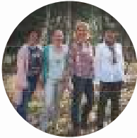
Team Reizen & Evenementen

Kortom, een bomvolle en gevarieerde evenementenagenda. We wensen je veel voorpret met deze gids en zien je graag op een van onze evenementen.